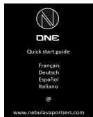
* Guida rapida